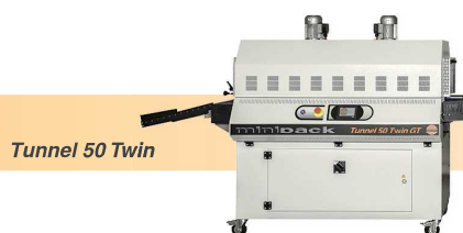
Tunnel 50 Twin