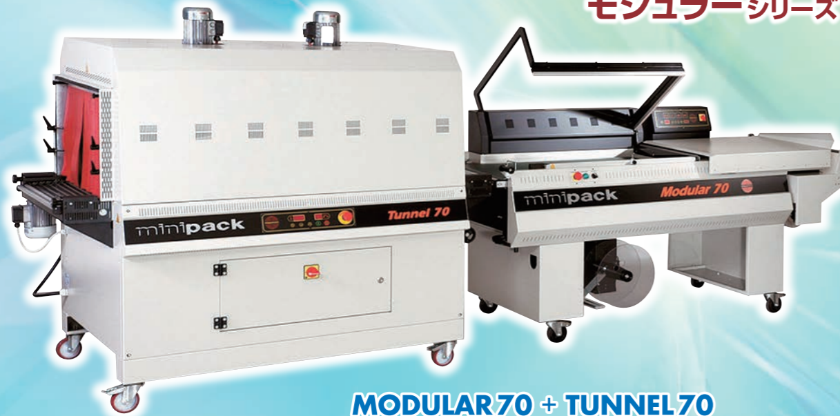
MODULAR70 + TUNNEL70