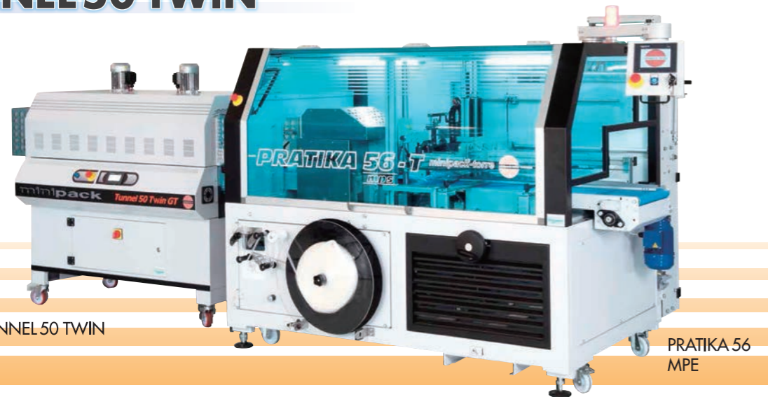
TUNNEL 50 TWIN