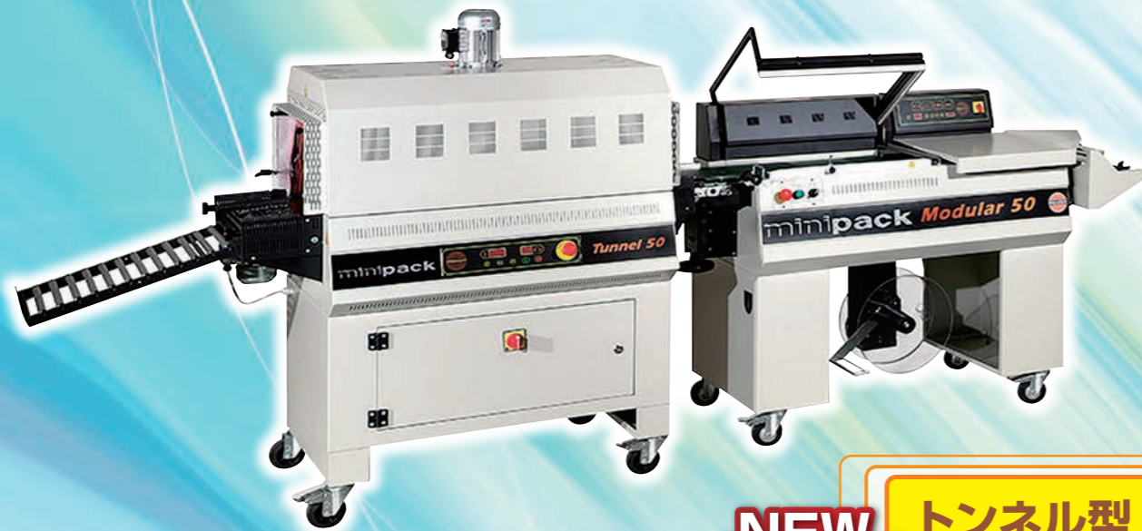
MODULAR50 + TUNNEL50