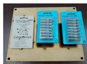
製品を取り出し (台紙圧着後)