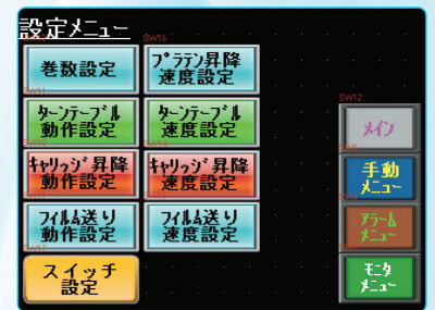
●設定メニュー画面