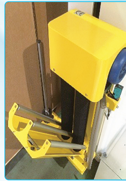
●フィルムキャリッジ