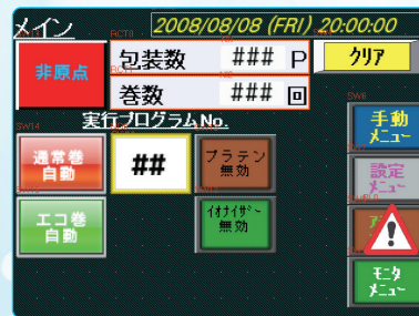
●タッチパネルメイン画面